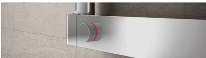
Bedienknopf „push & round“ mit LED-Temperaturanzeige.