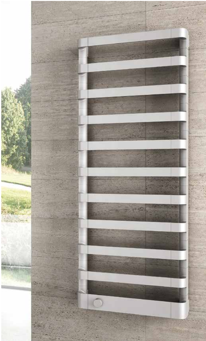
Step E 1255 x 500 mm, Silbergrau perl matt (Nr. L6).