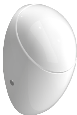
SLP 24 - ALESSI С КРЫШКОЙ