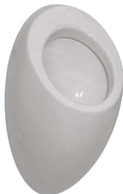
SLP 25 - ALESSI БЕЗ КРЫШКИ