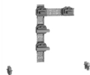
35 321 970 90 COMFORT SHOWER ATT Flexible Wellness Shower -

Другие поверхности по запросу (x-tra Service)