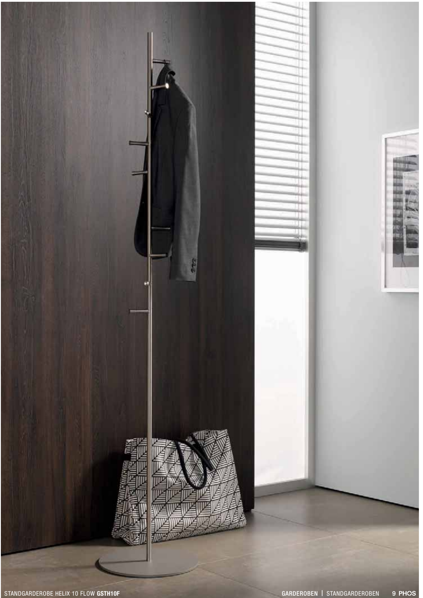
STANDGARDEROBE HELIX 10 FLOW GSTH10F