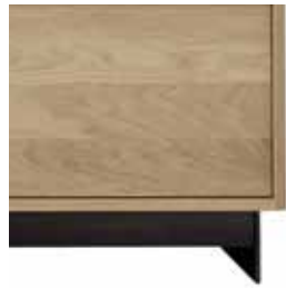
patas metálicas metallic legs