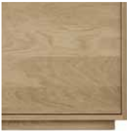
base madera wood base