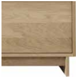
patas madera wood legs