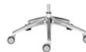
5 star base with casters Base 5 radios con ruedas Base a 5 branches avec roulettes