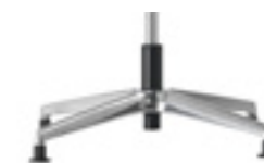
4 star base with fixed glides Base 4 radios con topes fijos Base a 4 branches avec patins fixes