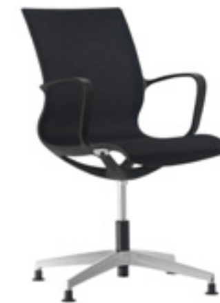
Black structure Estructura negra Structure noire