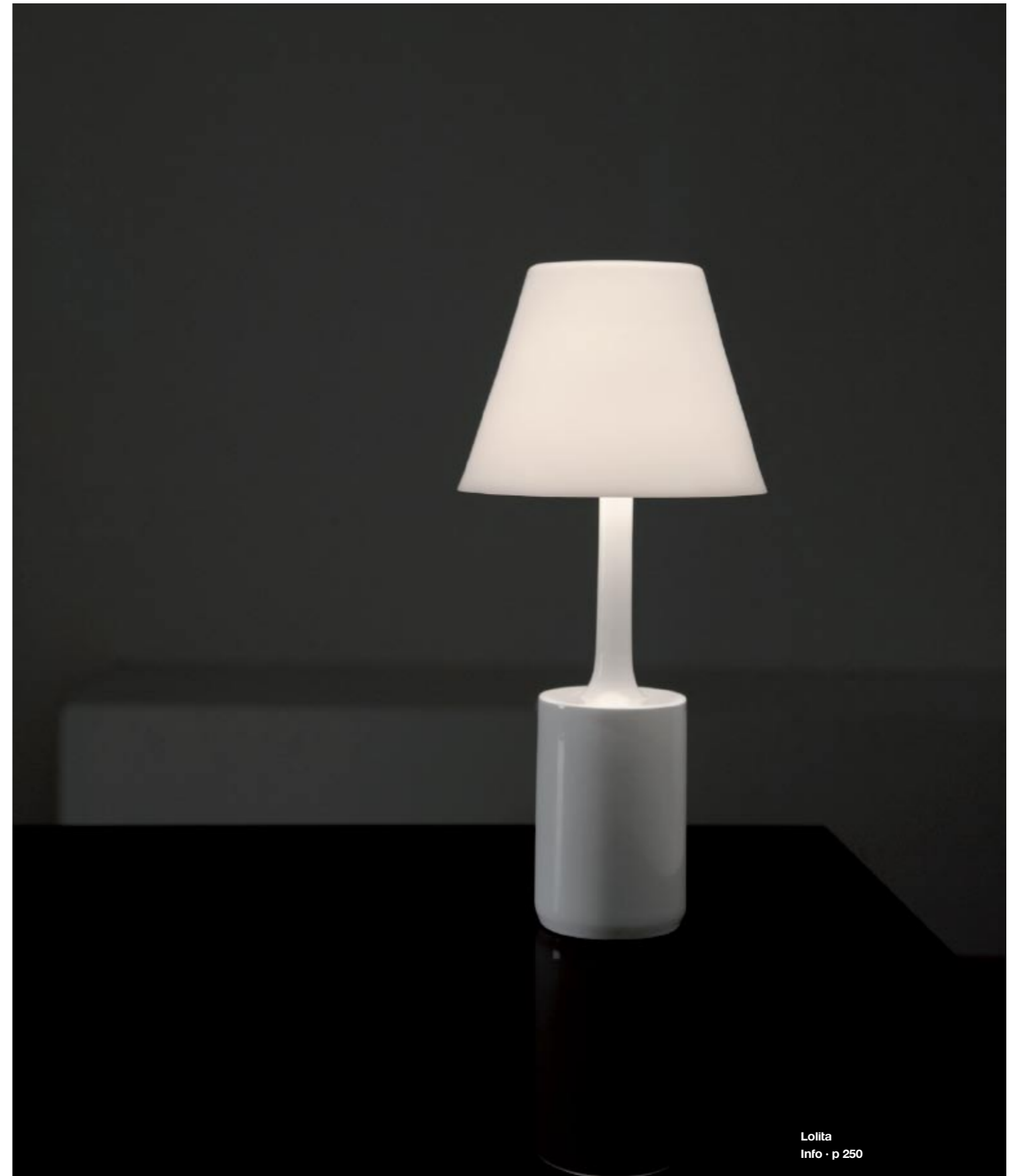
Lolita Info · p 250