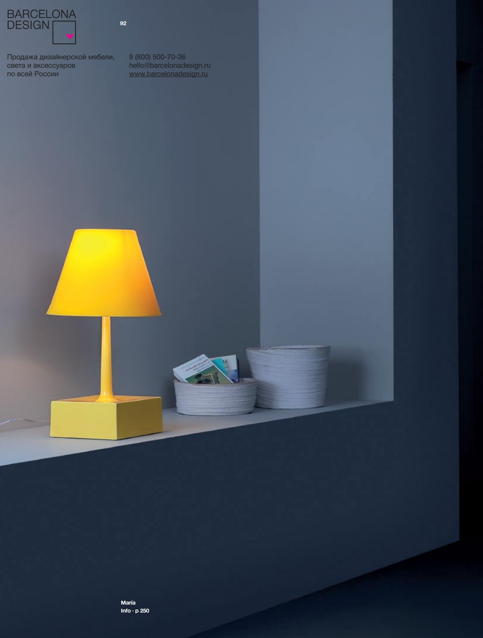
María Info · p 250