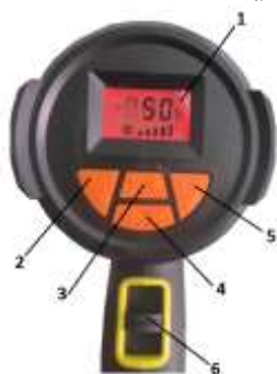
Рис.2. Панель управления

1-LED-индикатор; 2-клавиша «+» увеличения параметра; 3-клавиша выбора размерности шкалы-градус Цельсия или градус Фаренгейта; 4-клавиша управления воздушным потоком; 5-клавиша «-» уменьшения параметра; 6-выключатель