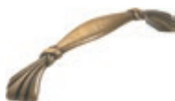
Maniglia "Aurora" in metallo finitura ottone brunito