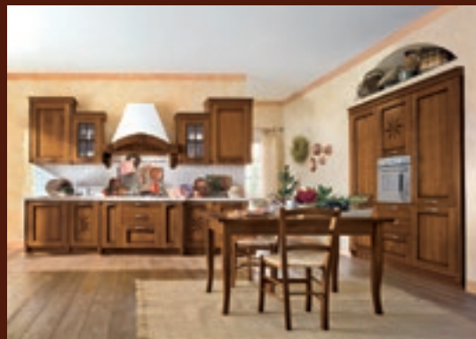
composizione 04 pag. 28