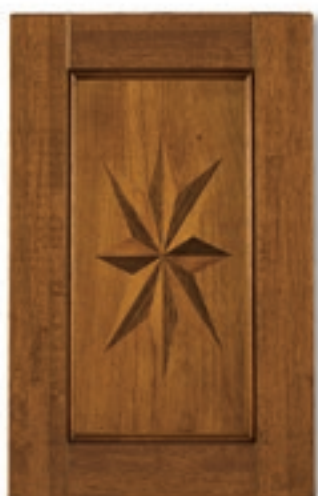
Noce con intarsio