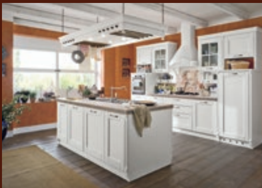
composizione 03 pag. 20