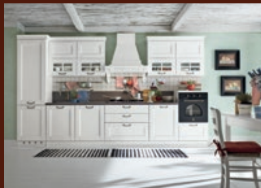
composizione 02 pag. 12