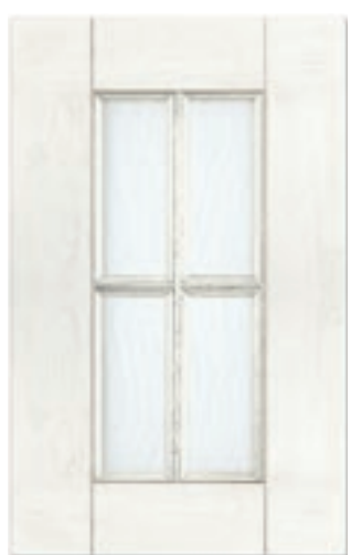
Finitura bianco Alba, con vetro trasparente e gratina