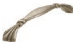
Maniglia "Aurora" in metallo finitura argento anticato