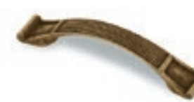
Maniglia "Alba" in metallo finitura ottone brunito (di serie per Alba bianca - standard)