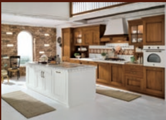
composizione 01 pag. 04