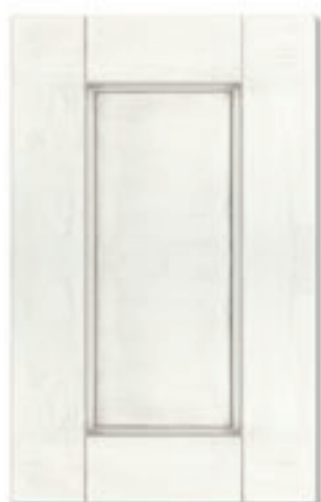
Finitura bianco Alba