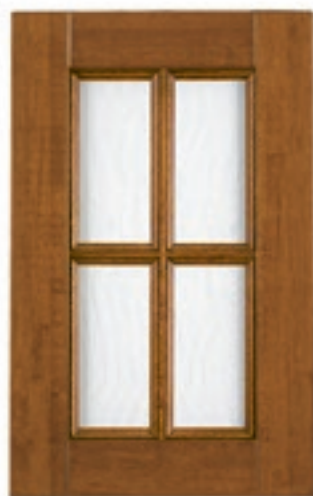
Noce, con vetro trasparente e gratina