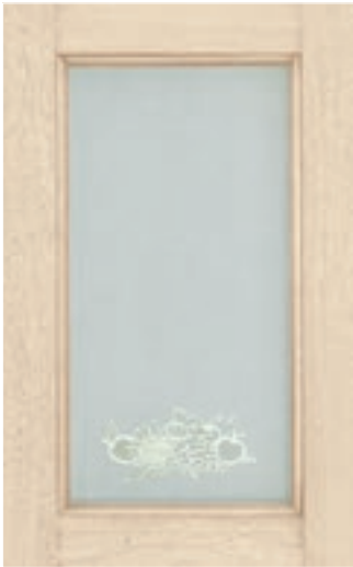
Decapè Bianco, vetro serigrafato