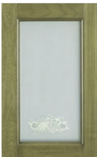
Verde Inglese vetro serigrafato