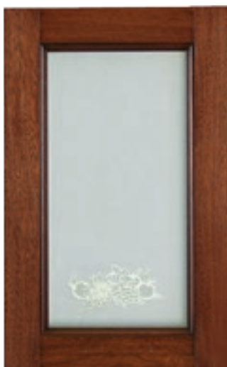
Noce, vetro serigrafato