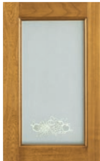
Giallo Country vetro serigrafato