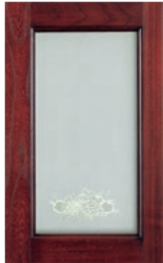
Rosso Borgogna vetro serigrafato