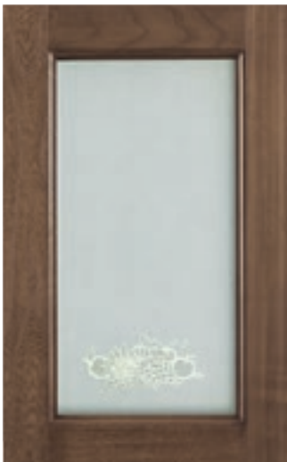
Terra D'ombra vetro serigrafato