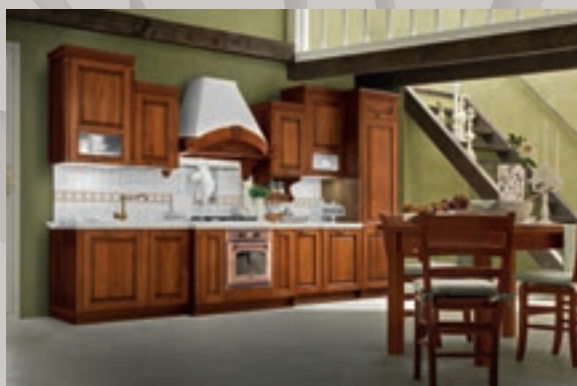
Vittoria 06 pag 46