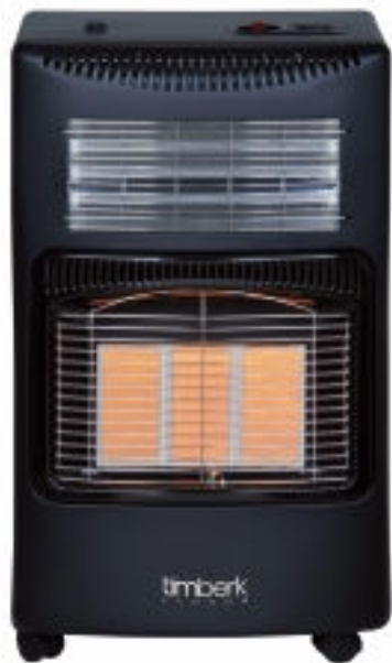
На рисунке: модель TGH 4200 M2