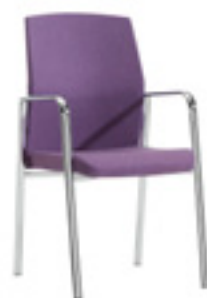
4 legs armchair Silón 4 patas Fauteuil 4 pieds