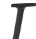
4D polyamide armrests Brazos de poliamida 4D Accoudoirs polyamide 4D