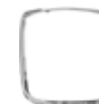
Fixed armrests Brazos fijos Accoudoirs fixes