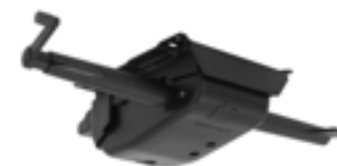
SY004 / SY104