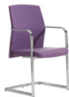
Cantiever armchair Silón pie patín Fauteuil pied luge