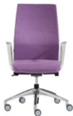
High backrest Respaldo alto Dossier haut