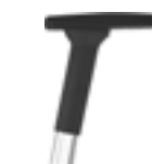
3D armrests Brazos 3D Accoudoirs 3D