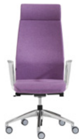
High backrest + headrest Respaldo alto + cabezal Dossier haut + tête