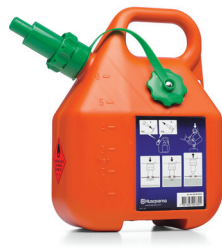
ТОПЛИВНАЯ КАНИСТРА ОБЪЕМОМ 6 ЛИТРОВ, ОРАНЖЕВОГО ЦВЕТА 505 69 80-01