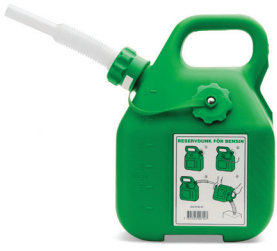
ЗЕЛЕНАЯ КАНИСТРА ДЛЯ БЕНЗИНА 505 69 80-40