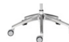
Polished aluminium base Base de aluminio pulido Base aluminium poncé