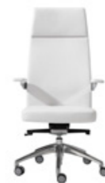
High backrest Respaldo alto Dossier haut