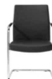
Cantiever armchair Silón pie patín Fauteuil pied luge