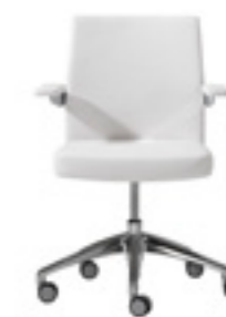
Low backrest Respaldo bajo Dossier bas