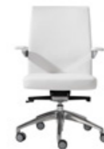
Medium backrest Respaldo medio Dossier moyen