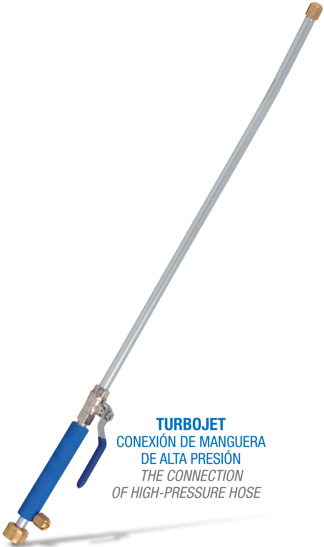
TURBOJET CONEXIÓN DE MANGUERA DE ALTA PRESIÓN THE CONNECTION OF HIGH-PRESSURE HOSE