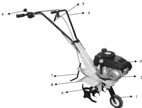
Схема компонентов культиватора TG-45