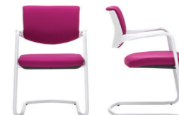
BASE FISSA FIXED BASE