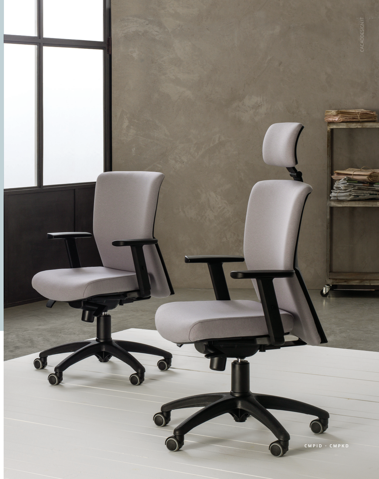
CMPID - CMPKD