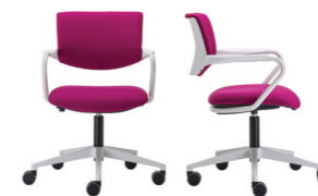
BASE GIREVOLE SWIVEL BASE