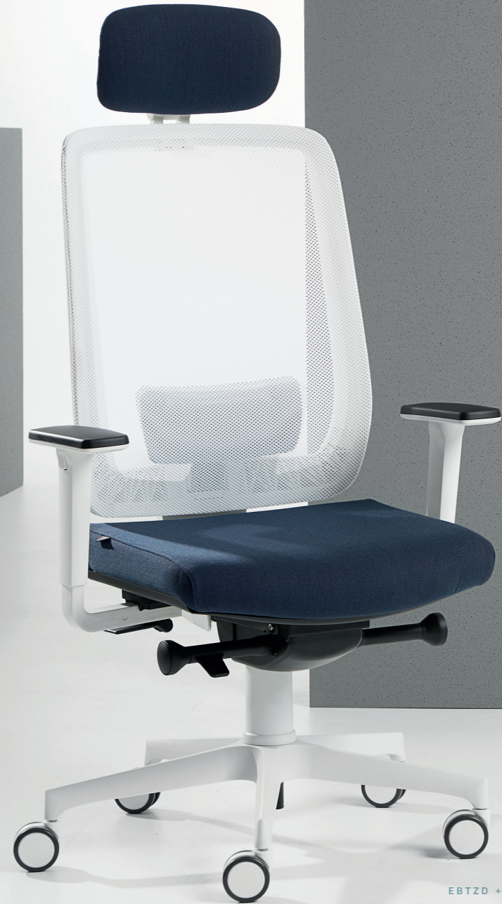
EBT2D + ELG1D - EBP5D + ELG1D - ENS1D + ELG1D