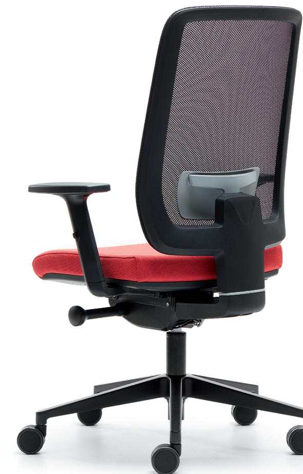
ENSID + EL1GD