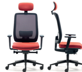
PLASTICA NERA BLACK PLASTIC