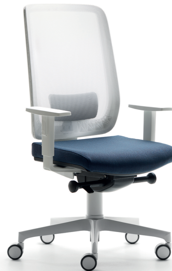
EBTID + ELG1D

Supporto lombare regolabile in polipropilene: a richiesta Polypropylene adjustable lumbar support: available on demand