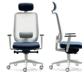
PLASTICA BIANCA WHITE PLASTIC