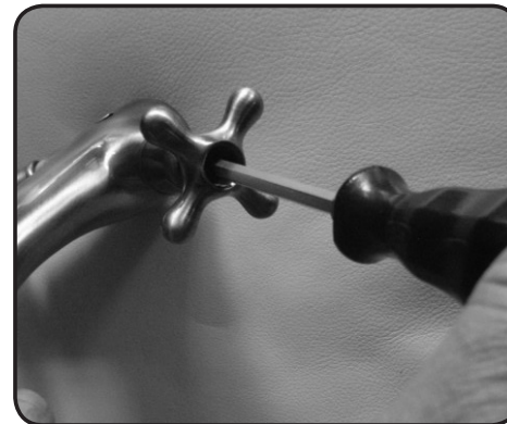
10. Skruva fast handtaget