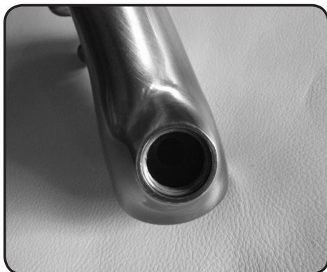
6. Kontrollera att blandarehuset är rent och oskadat.