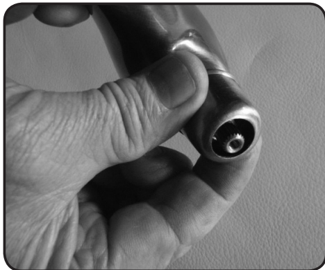
4. Lossa täckringen.