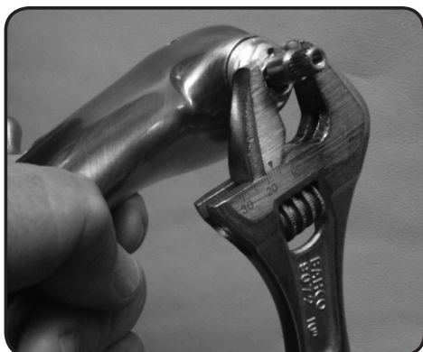
8. Skruva fast den nya insatsen.