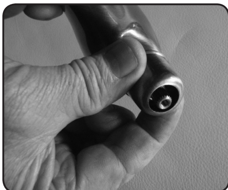
9. Skruva fast täckringen.