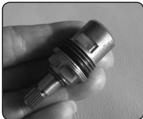
7. Montera den nya insatsen.