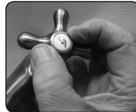
11. Skruva på knappen