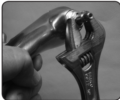
5. Lossa insatsen.