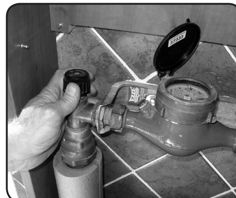
12. Sätt på huvudvattenledningen och kontrollera att inga läckor finns.