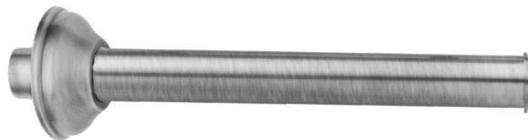
Sanitari e Consolle-Complementi Sanitari RB19126