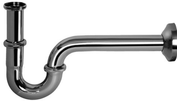
Sanitari e Consolle-Complementi Sanitari RFG147