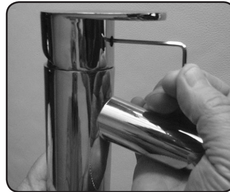
11. Skruva fast handtaget.