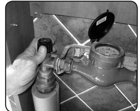
12. Sätt på huvudvattenledningen och kontrollera att inga läckor finns.