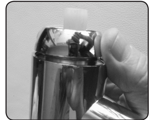
10. Skruva fast täckringen.