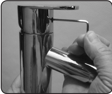
3. Lossa muttern med en 2,5 mm sexkantnyckel och lyft av handtaget.