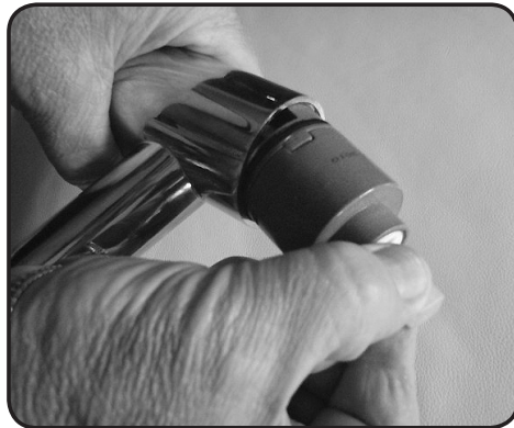
6. Lyft upp insatsen.