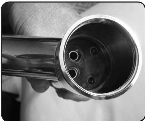
7. Kontrollera att blandarehuset är rent och oskadat.