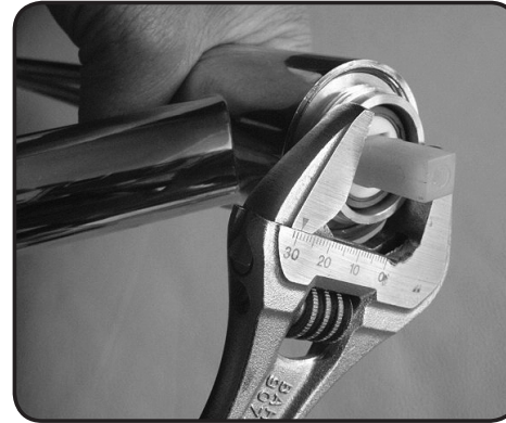
9. Skruva fast låsmuttern och spänn den så hårt att packningarna blir täta och att handtaget kan regleras med mjuka rörelser.