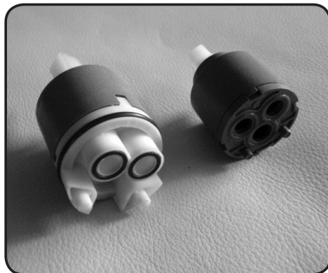
8. Montera den nya insatsen och kontrollera att styrningarna i botten är i rätt läge.