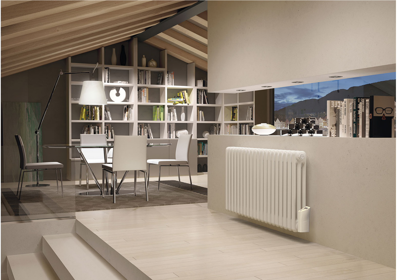
Tesi 3 Elettrico, verticale, 20 elementi, altezza 602 mm, larghezza 962 mm, elettrico con controllo elettronico, Bianco Standard

Il Termoarredatore Tesi è disponibile nella versione elettrica con liquido termovettore, nella versione 3 colonne e nell'altezza 602. Tale modello rappresenta la soluzione più funzionale ove non sia possibile il collegamento all'impianto di riscaldamento, o come integrazione dello stesso.