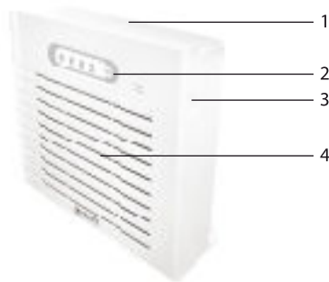
Fig. 1 (front panel)