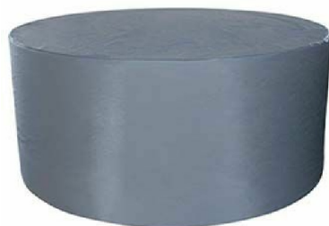
RK5118: Copertura leggera per Minipool free standing / Light cover for free standing Minipool