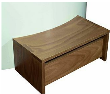
5GDOK: Gradino in legno okumè per Minipool free standing / Step in okumè wood for free standing Minipool

9S2TBIRSBI-TR Proposto con / Proposed with