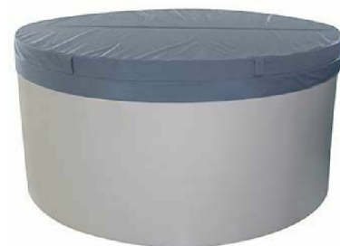
RK5254: Copertura termica per Minipool free standing e incasso / Thermo insulation cover for free standing and built-in Minipool