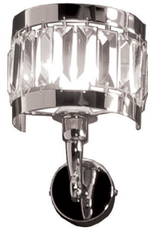
Illuminazione - Lumina - APGI07