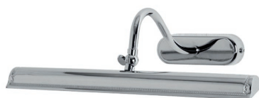
Illuminazione - Minima - LEGGIO32