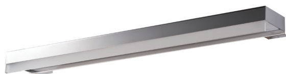
Illuminazione - Minima - NEON