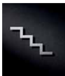
P3101 – 79x117 mm

Ideal zur Kombination mit anderen Piktogrammen