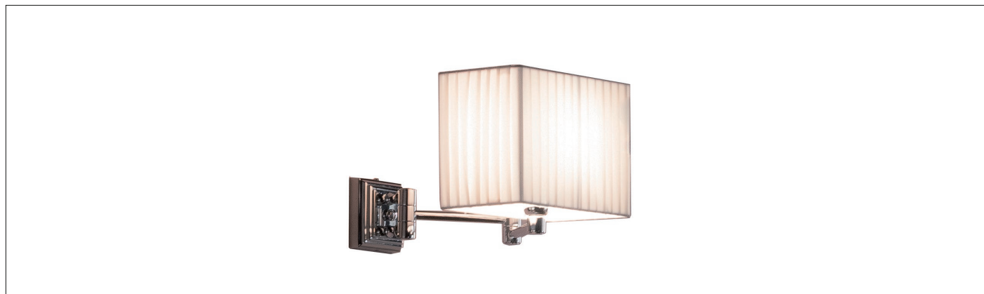
Illuminazione - Sandy - APAM30