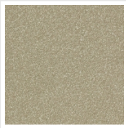
Quartz 2 Cod. 2C