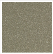
Sunstone Cod. 2D