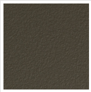
Bruno Tabacco Cod. 1B