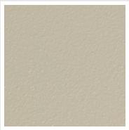
Sablé Cod. Y4