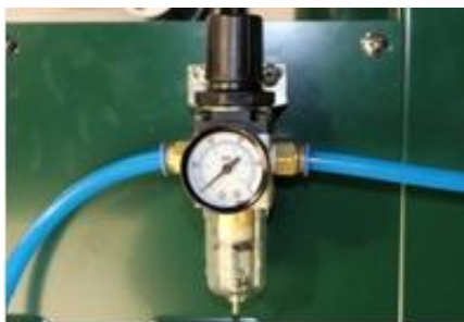
Фильтр влагоотделитель с редуктором