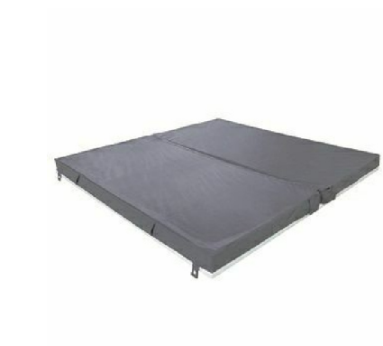
RK5135: Copertura termica per Quadrat free standing / Thermo insulation cover for free standing Quadrat pool.

9S5TBIRSOTR Proposto con / Proposed with