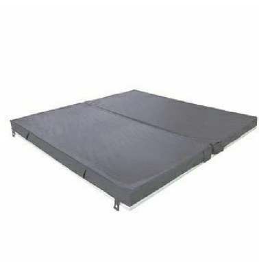
RK5148: Copertura leggera per Quadrat free standing / Light cover for free standing Quadrat pool.