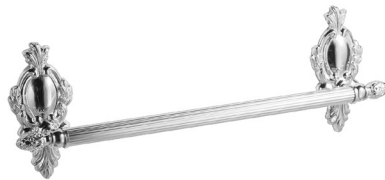
Accessori - Imperiale - AAIM09