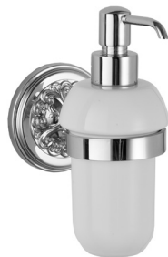
Accessori - Lexington - AMLE05