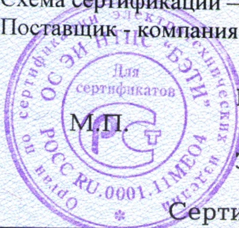
Схема сертификации – 7 Поставщик – компания «PROGETTO TRE s.r.l.» (Италия)