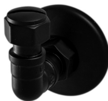
Accessori - Tubo' - AMTU06