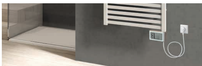
Mido Q EK 1517 x 580 mm mit komplett werksmontiertem Elektroheizstab inklusive digitalem Uhrenraumthermostat, bauseits an Steckdose angeschlossen.