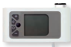
Digitales Uhrenraumthermostat (serienmäßig)