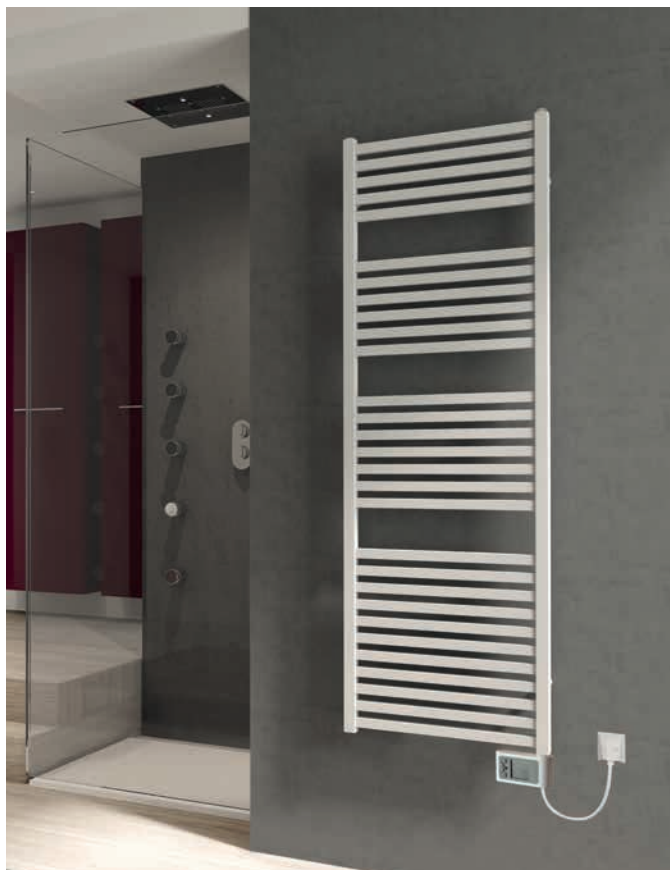
Mido Q EK 1517 x 580 mm mit komplett werksmontiertem Elektroheizstab inklusive digitalem Uhrenraumthermostat, bauseits an Wandanschlussdose angeschlossen.