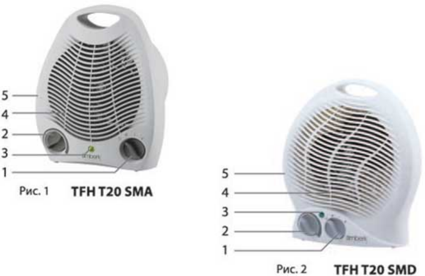
Рис. 1 TFH T20 SMA