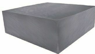
RK5148: Copertura leggera per Quadrat free standing / Light cover for free standing Quadrat pool.