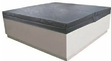
RK5135: Copertura termica per Quadrat free standing / Thermo insulation cover for free standing Quadrat pool.

9S4TBIRS---M Proposto con / Proposed with