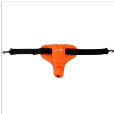
Anschnallgurte in vielen Farben (verfügbar für alle Modelle)