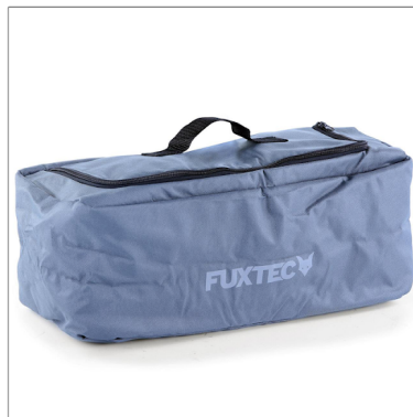
Kühltaschen in vielen Farben (verfügbar für alle Modelle)