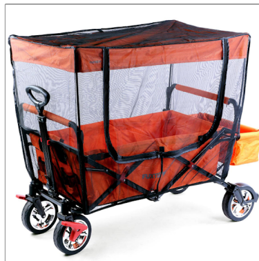
Sonnen und Insektenschutz (verfügbar CT500, CT700+CT800 Modelle)