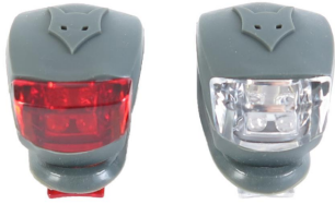
Опционально- габаритные огни