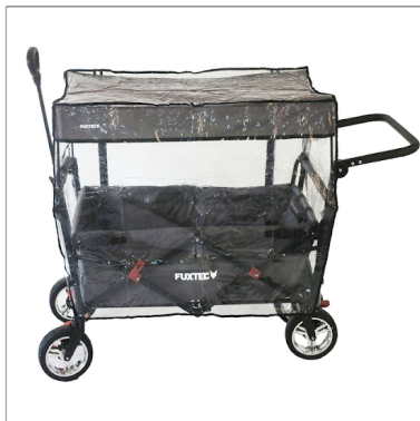
Regenschutz transparent (verfügbar für CT500,CT700 +CT800 Modelle)