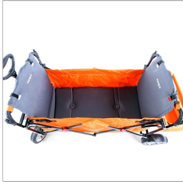
Bollerwagenmatten kurz und lang (verfügbar für alle CT500 und CT700 Modelle)

www.fuxtec.de/heim-und-freizeit/bollerwagen/zubehoer/ oder QR Code per Smartphone scannen.