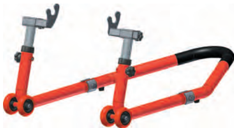
Рис. 4 - Установка подхватов под слайдеры 16.76