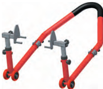
Рис. 3 - Установка универсальных подхватов 16.75