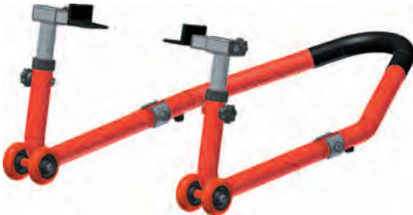
Рис. 2 – Установка подхватов под маятник 16.74