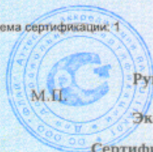
Схема сертификации: 1