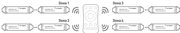
Рисунок 3. Вариант построения системы с 4-зонным пультом дистанционного управления.