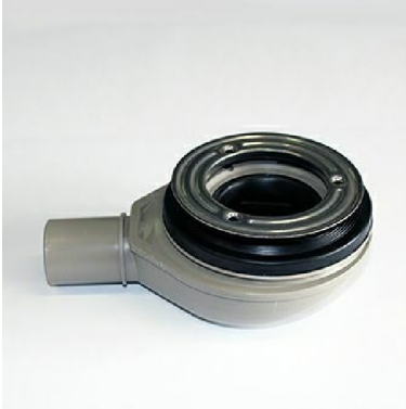
5S4CR: Piletta sifonata / Siphonated drain plug.

4SRL80140BP Proposto con / Proposed with