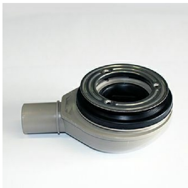
5S4CR: Piletta sifonata / Siphonated drain plug.

4SRL80120BP Proposto con / Proposed with