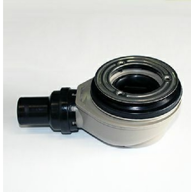
5S5CR: Piletta sifonata / Siphonated drain plug.