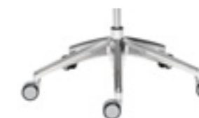
Polished aluminium base Base de aluminio pulido Base aluminium poncé