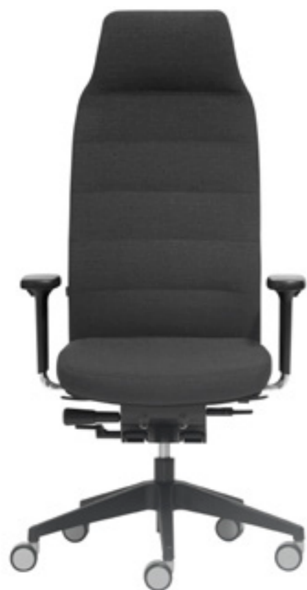
Chair ITEK 200 with high backrest Silla ITEK 200 respaldo alto Siège ITEK 200 avec dossier haute