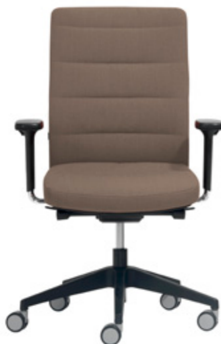
Chair ITEK 200 with low backrest Respaldo bajo tapizado Siège ITEK 200 avec dossier bas