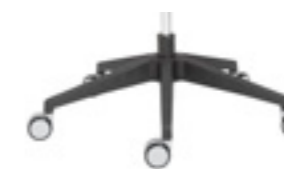
Polyamide base Base de poliamida Base polyamide