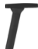
4D polyamide armrests Brazos de poliamida 4D Accoudoirs polyamide 4D