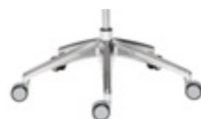
Polished aluminium base Base de aluminio pulido Base aluminium poncé