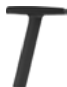
Fixed armrests Brazos fijos Accoudoirs fixes