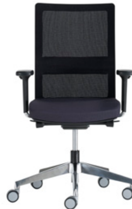
Medium backrest Respaldo medio Dossier moyen