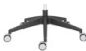
Polyamide base Base de poliamida Base polyamide