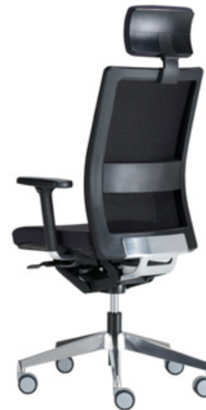
Medium backrest + headrest Respaldo medio + cabezal Dossier moyen + tête