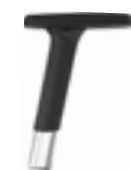
4D multipurpose arms Brazos multifunción 4D Accoudoirs multifonction 4D