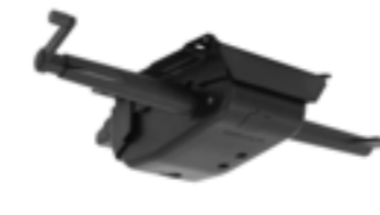
SY004 / SY104