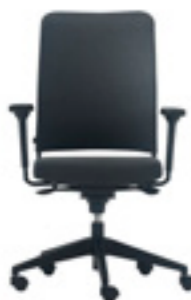
Upholstered high backrest Respaldo alto tapizado Dossier haut tapissée