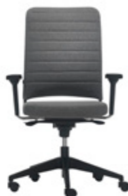
Upholstery with horizontal stripes Tapizado rayas Tapissage avec surpicures horizontales