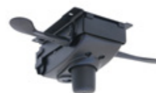
SY006 / SY106