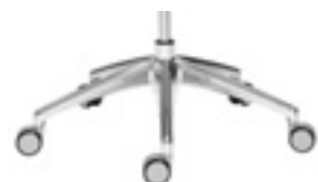
Polished aluminium base Base de aluminio pulido Base aluminium poncé