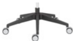
Polyamide base Base de poliamida Base polyamide