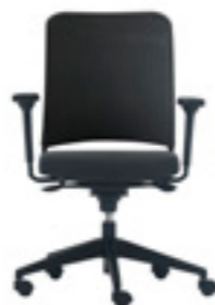
Medium backrest with mesh Respaldo medio con malla Dossier moyen resille