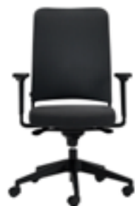
High backrest with mesh Respaldo alto con malla Dossier haut resille